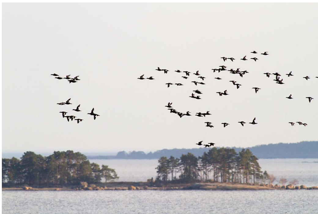
Pilkkasiipien arktinen muuttomatka Virolahdella

KUNNANHALLITUS 11.12.2017 KUNNANVALTUUSTO 18.12.2017